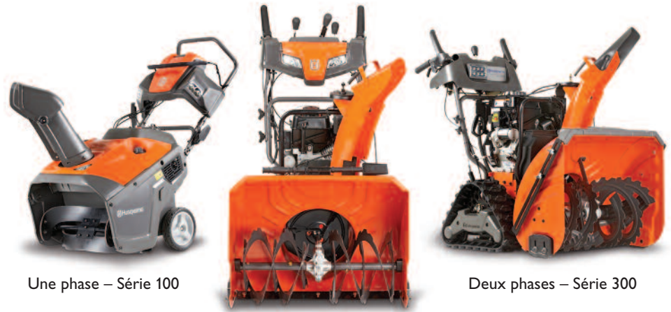
Une phase – Série 100