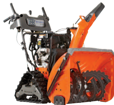
SÉRIE 300 – ROUES